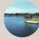
3. GOLF COURSE 3. CAMPO DE GOLF