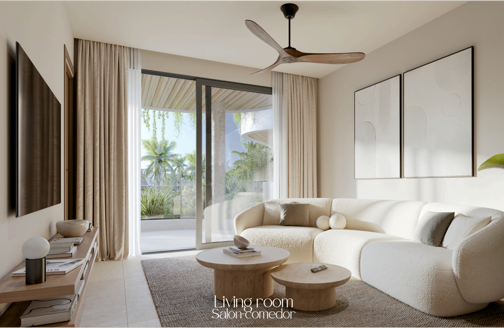
Living room Salon-comedor