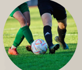
8. SPORTS AREA 8. AREA DEPORTIVA