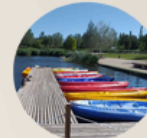
6. DOCK 6. MUELLE