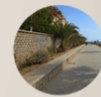
11. ECOLOGICAL ROAD PERIMETER SECURITY PERIMETER 11. CAMINO ECOLOGICO PERIMETRO SEGURIDAD