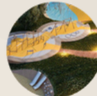
5. PARK 5. PARQUE