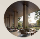
2. HOTEL 2. HOTEL