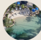
9. LA CORALINA 9. LA CORALINA