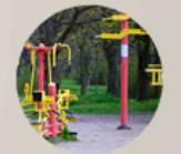
12. SENIOR EXERCISE PARK 12. PARQUE EJERCICIO SENIOR

Coral Golf Resort promotes integration and recreation through the inclusion of services. This is achieved by identifying key activity hubs, which are strategically placed to meet the demand of new developments.