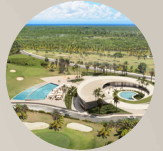
4. CLUBHOUSE 4. CASA CLUB