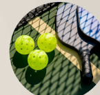
7. PICKLEBALL 7. CLUB RAQUETA