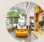
10. OFFICES 10. OFICINAS