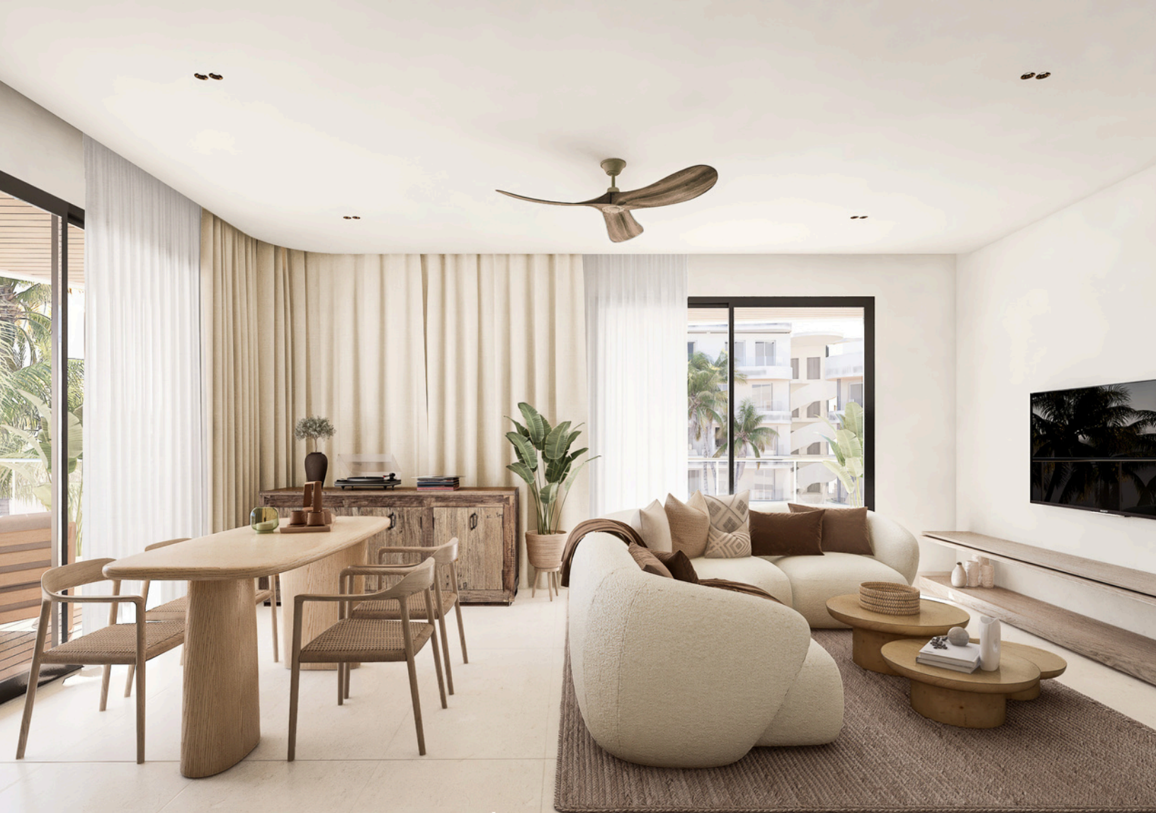
Living room Salón-comedor