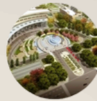
1. ACCESS AND COMMERCIAL AREA 1. ACCESO Y ZONA COMERCIAL